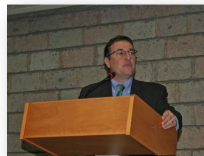
M. Achim Steiner (UNEP)

Les participants ont formulé des résolutions claires qui affirment leur engagement à préserver et à sauvegarder la terre pour les générations présentes et futures. Les responsables religieux ont fait appel aux leaders du monde, aux politiciens et aux décideurs d'adopter une position qui mettra en place un accord juridiquement contraignant au cours de la COP 17. Ceci ne pourra être faisable que si les partenaires clés adoptaient une position pragmatique non égoïste qui traite des sujets clés en Afrique qui alimentent la dégradation environnementale et encouragent la sustentation de la bio diversité et une exploitation durable des ressources naturelles, ont dit les participants.