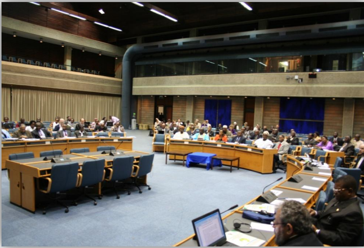
Participants de la conférence Panafricaine sous le thème justice climatique et la paix durable en Afrique, pendant un des sessions

En cet âge de la dégradation environnementale, la Conférence des Eglises de Toute l'Afrique (CETA), le Programme des Relations Islamo-Chrétiennes en Afrique (PRICA) et l'Institut Environnemental des Communautés de Foi de l'Afrique Australe (SAFCEI), ont organisé une conférence panafricaine des responsables religieux sur le changement climatique. La conférence dont le thème était 'Climat Justice et Paix durable en Afrique' a déploré l'exploitation rampante des ressources de la terre pour des profits. Ils se sont demandés