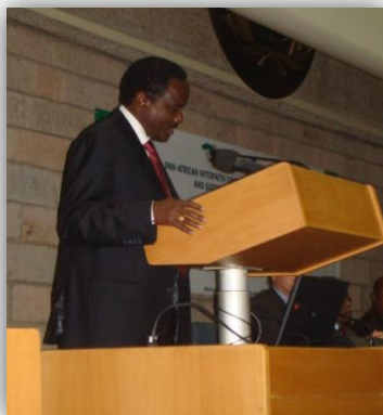
Vice Président du Kenya Kalonzo Musyoka

L'invité d'honneur qui a aussi procédé à l'ouverture officielle des travaux de la conférence, son Excellence M. le Vice Président de la République du Kenya l'hon. Kalonzo Musyoka a exprimé sa joie pour un tel rassemblement et a vivement appelé les responsables religieux de s'assurer que les résultats de leurs délibérations soient communiqués à leurs gouvernants afin que « nous puissions ensemble traiter de ce problème important qui affecte nos vie ». M. Achim Steiner, Directeur exécutif du PNUE a apprécié les organisateurs et a imploré les responsables religieux à participer de façon active dans les discussions sur le changement climatique.